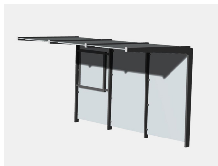
SITHU Informationsvitrine Art.-Nr. 23 02 17