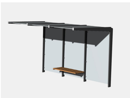
SITHU integrierte Sitzbank Art.-Nr. 23 02 16