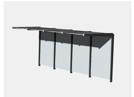
SITHU Wartehalle, 4 Felder Art.-Nr. 23 02 20