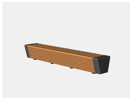
SITHU Hockerbank 0,45 x 3,00m Art.-Nr. 23 02 12