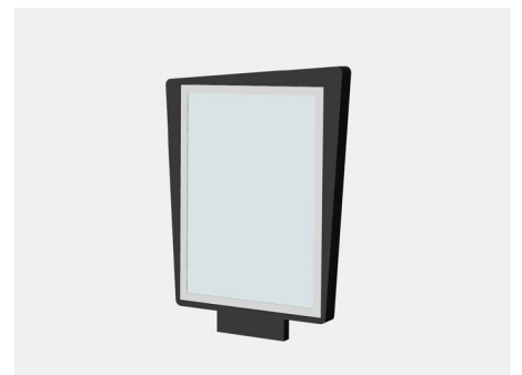
SITHU Werbevitrine Art.-Nr. 23 02 15